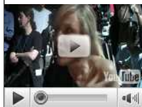
Guarda gli altri video