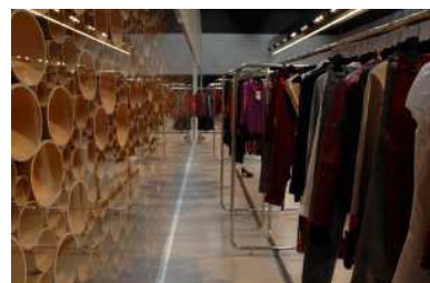
Interno Showroom Atos Lombardini